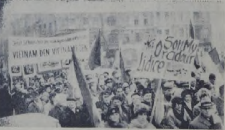
Pe străzile Berlinului s-a desfășurat zilele trecute o mare manifestație în favoarea poporului vietnamez, a luptei sale pentru libertate și a lăcelării atrocităților armatelor S. U. A. În fotografia: Aspect de la demonstrația din Berlin. Pe pancarte se poate citi «Vietnamul pentru Vietnam». «Siamo My» «Grado» «Udite», ter aficea albă, nouă negre pe obrazul umanității.

BANGKOK 25 (Agerpres). — După cum anunță agenția UPI, autoritățile tailandeză au început să retragă efectivele militare din Vietnamul de sud. Decizia trupelor tailandeză în Vietnamul de sud se ridică la 10.000 de militari.