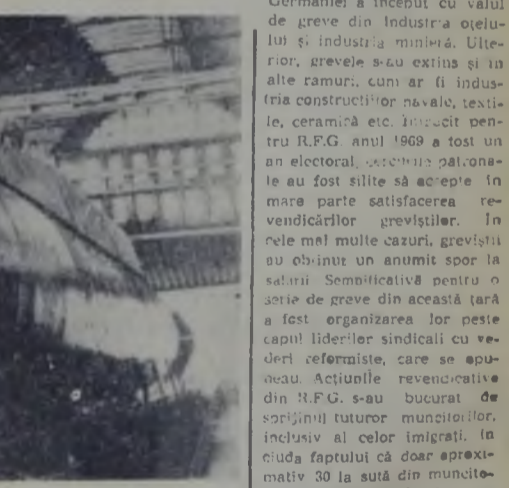
FRANȚA. Al doilea submarin francez propulsat cu energie nucleară va fi lansat la apă la sfârșitul lunii noiembrie. Submarinul are o lungime de 128 m și o echipaj de 130 persoane. Cel de-al treilea submarin nuclear francez, «Le Foudroyant» va fi lansat la apă în ianuarie. În fotografie: Submarinul «Le Terrible» la Gherbourg.

Ampla mișcare revendicativă din Republica Federală a Germaniei a început cu valul de greve din industria oțelului și industria minieră. Ulterior, grevele s-au extins și în alte ramuri, cum ar fi industria construcțiilor navale, textile, ceramică etc. Început pentru R.F.G. anul 1969 a fost un an electoral, anul școlii patronale au fost silite să accepte în mare parte satisfacerea revendicărilor greviștilor. În cele mai multe cazuri, greviștii au obținut un anumit spor la salarii. Semnificativ pentru o serie de greve din această țară a fost organizarea lor pe capul liderilor sindicali cu vederi reformiste, care se opuneau Acțiunile revendicative din R.F.G. s-au bucurat de sprijinul tuturor muncitorilor, inclusiv al celor imigrați. În ciuda faptului că doar aproximativ 30 la sută din muncitorimea vest-germană este cu origină în străinătate.