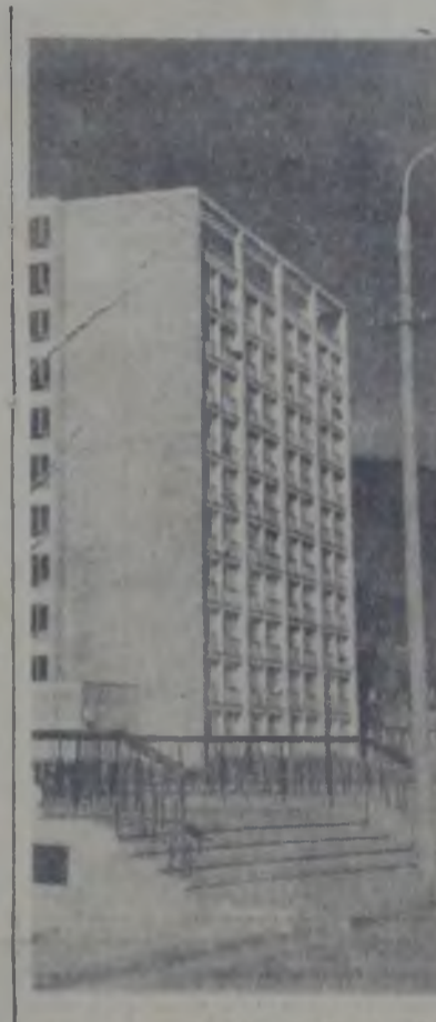
Piatra Neamț — arhitectura modernă

Și cu toate acestea, soluțiile de prospectare a pieței externe nu lipsesc. Sînt șansa mare de a valorifica deșeurile de fier, noi informăm directorii comerciali ai Centralei pentru fabric chimic Savinesti, Gh. Dobriban. Rezonul însă se vinde la străine. O comparație între prețurile cu care se vind deșeurile (10 lei/kg) și aproximativ 100 lei (prețul unui produs finit), este tardivă dar cu atât mai convingătoare. Se pune totuși în trebură, instalațiile de la Savinesti asigură calitatea stipulată de furnizorii străini? Producerea instalațiilor aduse din import procentele de calitate I, calitatea II și deșeurile înscrise în cărțile lor tehnice? Unii factori de răspundere ne-au asigurat că prin eforturile specialiștilor noștri, unele instalații asigură o calitate mult mai bună decît cea prestată.