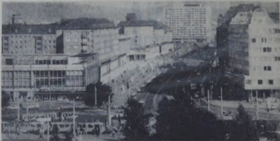
Orasul Dresda (R.D. Germană) la creșutul innoțirii.

Comunicatele sint contradictorii, ambele guverne acuzându-se reciproc de acte de agresiune. Conform comunicatului dat publicității la Djeddah, for-