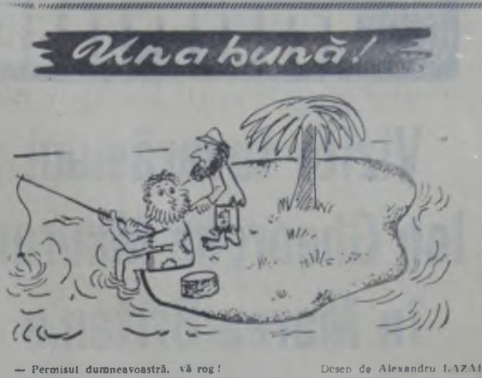
— Permisul dumneavoastră, vă rog! — Desen de Alexandru LAZAR