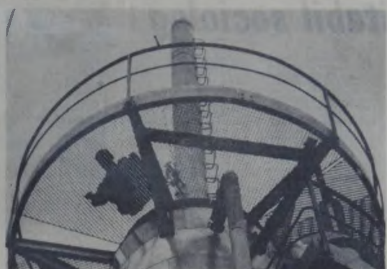
Simetrii industriale

Un grajd pentru tineretul vaurin, la punctul Cîrlin, se află în construcție în acest stadiu înzidit în beton. Din acest motiv 20 de vaci cumpărate se află în custodia la C.A.P. Bălănești. Nici cele cinci grajduri pentru taurine de la Șerbesti