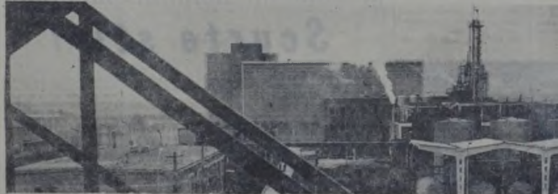
Vedere parțială a Uzinei de fibre și îngrășăminte chimice Săvinești.