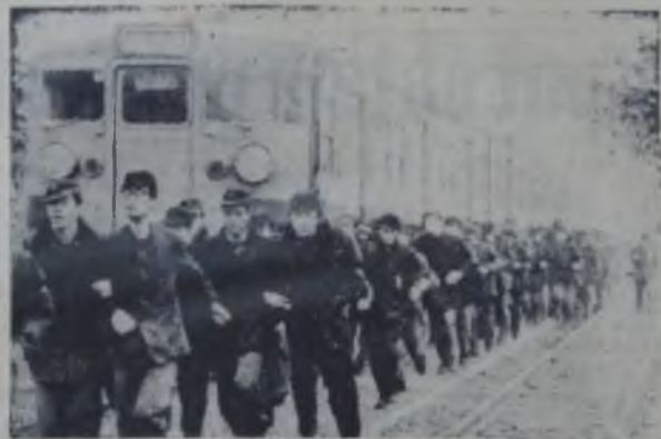
JAPONIA. — Cea mai lungă grevă de după război a durat 14 ore și jumătate și a dus la suspendarea traficului pe linia Tokaido și alte linii de la Hokkaido la Kyusku. Ea a fost organizată de muncitorii Căilor Ferate pentru a preveni desfășurarea posturilor de asistenți ingineri pe locomotivele diesel electrice și pentru reducerea orelor de muncă. În foto: O demonstrație a greviștilor printre trenurile oprite.

„Marșul împotriva morții”, care a dominat timp de 40 de ore capitala americană este caracterizat de toate agențiile de presă ca o „mare manifestare pașnică” împotriva războiului. Cu toate acestea autoritățile au încercat să prezinte demonstrațiile drept o încercare de violență. „Violență nu este ceea ce s-a petrecut la Washington și în alte orașe americane”, a declarat unul dintre liderii „Noului comitet de mobilizare”, organizatorii marșului. „Violență — a adăugat el — este faptul că în timp ce în S.U.A. oamenii manifes-