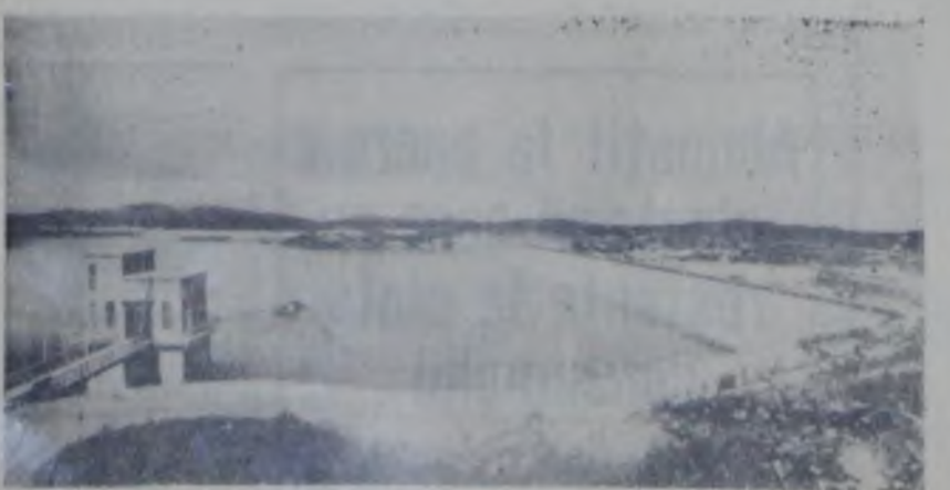
Rezervorul Tielhina de în Tungșun, provincia Liaoning (R. P. Chinez).

Având în vedere că proiectul de lege răspunde necesităților actuale etape de dezvoltare a statului nostru, comisiile vă roagă să vă însușiți textele în forma în care ele vă sînt propuse.