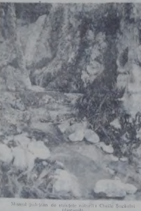
Monumentul județean de științele naturii I. Cheile Șuguluii (dioramă)