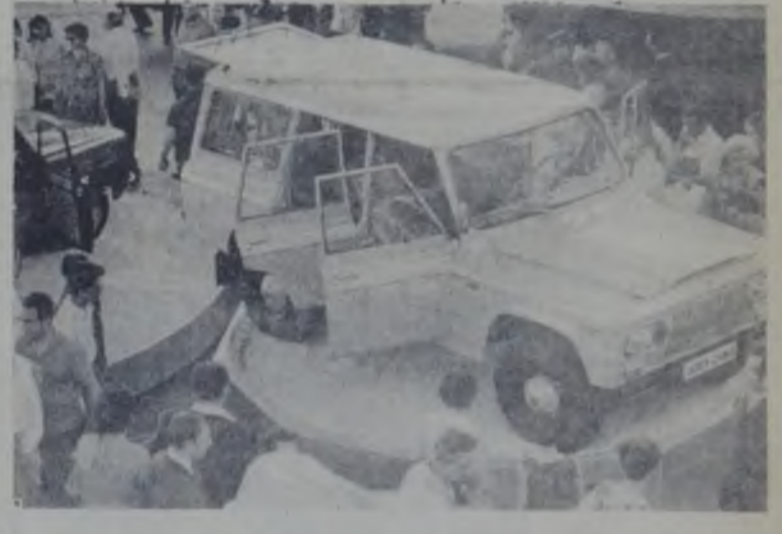
O nouă automobilistică românească — ARD.

BEȘTI (președinte Neculai COCȘI) — 249 din 398 și UȘĂCENI (președinte Ștefan OLTEANU) — 208 din 366. Sunt și unități cooperatiste care restanțează în livrarea produselor. C. A. P. ICUSEȘTI, RĂUCIȘTI, ROMANI, de exemplu, care livrat nimic din cantitățile stabilite în contracte. Altele — Herța, Doljesești, Doljesești, Ghigolești, Pădesești, Găsești — au restanțe în întregime sau aproape în întregime. Pentru o mai bună înțelegere a conducerilor acestor C. A. P. și a celor de obligațiile asumate cu bună știință, pe baza de bună credință? Știm că respectarea unor obligații contractuale este totuși o obligație morală a semnatarilor, dar implică și o obligație juridică. Ei nu știu ?