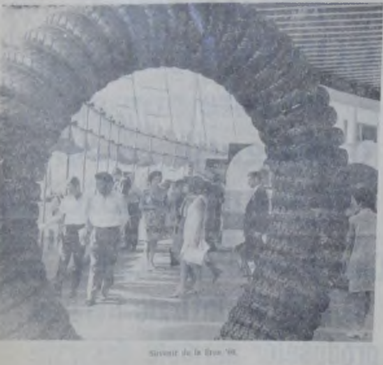
Arhitectură de la Timișoara