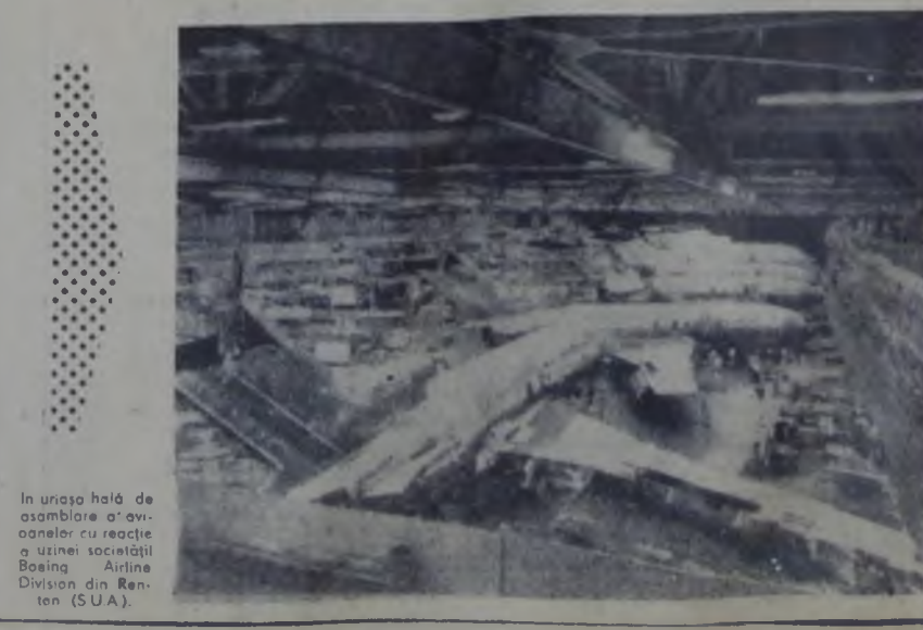
TIPARUL Întreprinderea poligrafică Becau.