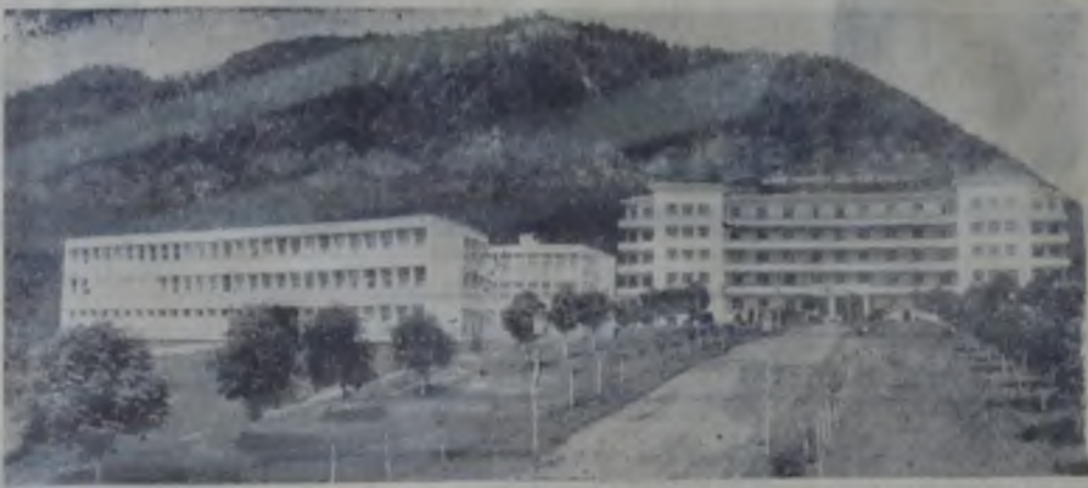
Spitalul și nava policlinică din Piatra Neamț.