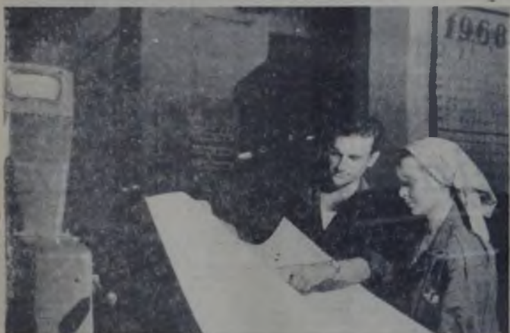
Multă atenție calității. Imagine de la Fabrica de hirtie și cartoane „Comuna din Paris”.