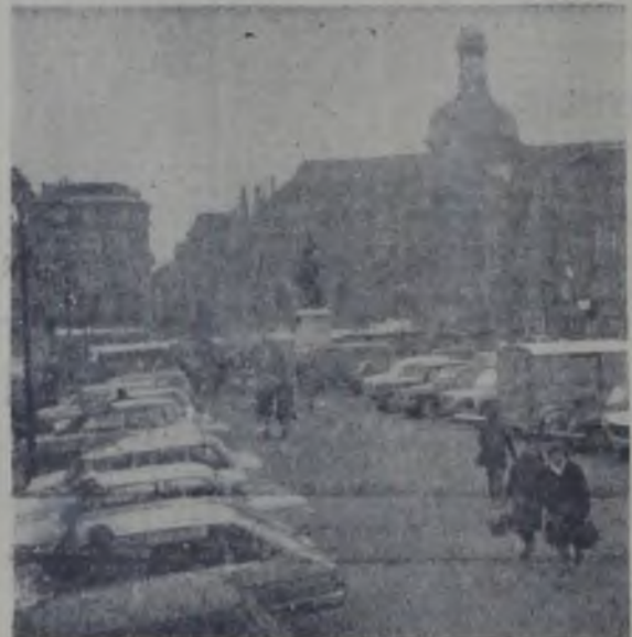
Vedere din Dieppe (Franța).

BELGRAD 10 (Agerpres). — Președintele Republicii Arabe Unite, Gamal Abdel Nasr, a sosit miercuri la Belgrad, într-o vizită de prietenie în Iugoslavia. După cum anunță agenția Tanjug, la sosire el a fost întâmpinat de Josip Broz Tito, președintele R.S.F. Iugoslavia, precum și de alți înalți conducători de stat ai Iugoslaviei.