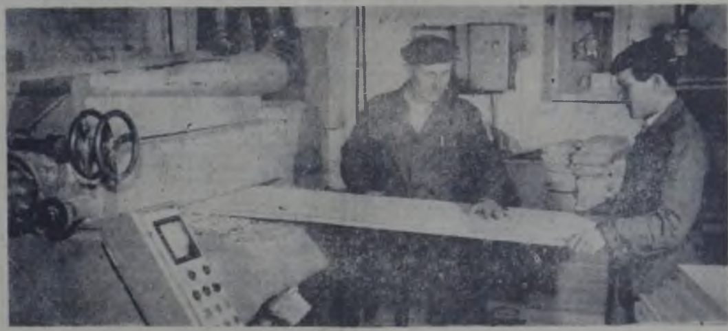
Aspect de la L.I.L. „Lemn și mobilă” din Roman.