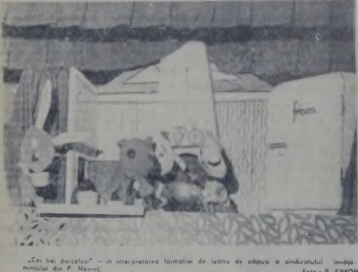
„Cei trei porceluzi” - în interpretarea formației de teatru de păpuși a sindicatului învășimintelului din P. Neamț.