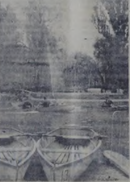
Acolo unde siluetele ploilor tale legănările undelor...