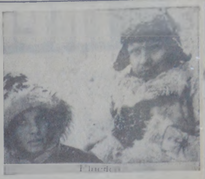
Secvență din filmul „Flacăra olimpică”, prezentat pe ecranul cinematografului „Victoria” din Tîrgu Neamț.