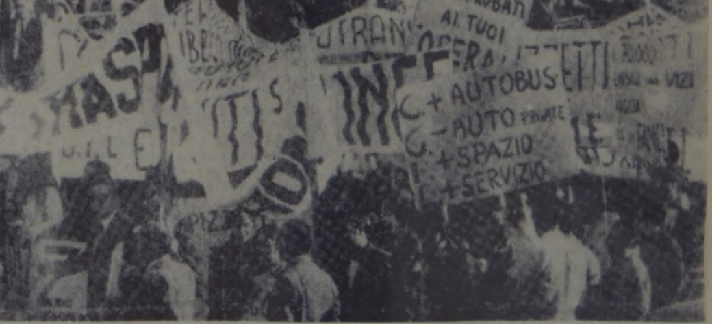
ITALIA. — O demonstrație muncitorească în piața Sf. Apostoli din Roma, împotriva proastei organizări a transporturilor în comun, atât cel de stat cât și cel particular. Demonstrația a provocat blocarea circulației pe câteva ore.

A urmat o demonstrație la care au participat 300.000 de oameni ai muncii din Phenian.