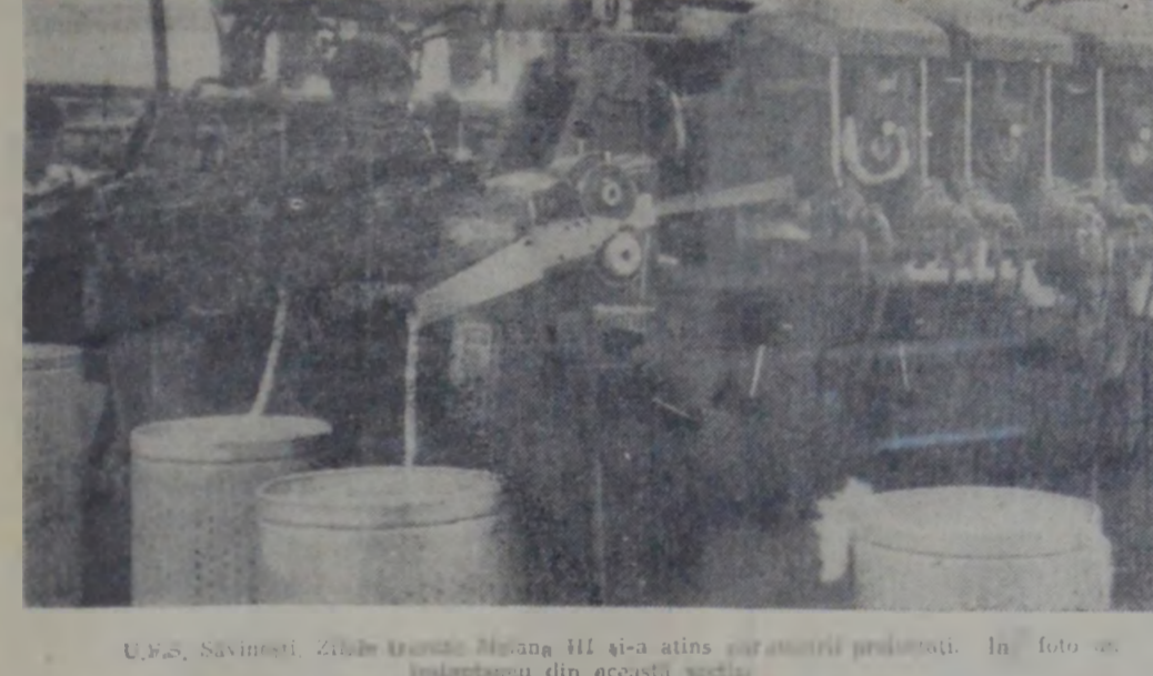
U.J.C.S. Săveșni. Zilele lucrului zilnic III și-a atins cel mai înalt nivel de producție. În foto: un instantaneu din această viață.

In pagina a IV-a • Situația din Cambodiaa • Scurte știri • Faptul divers pe glob