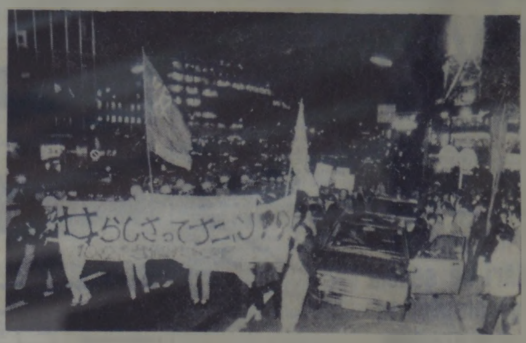
JAPONIA. — În 105 centre din 45 de prefecturi, peste 1.200.000 de persoane au demonstrat împotriva războiului dus în Indochina și cerind totodată abolirea Tratatului de securitate japono-american.

PHENIAN 11 (Agerpres). — În raportul cu privire la planul șezual de dezvoltare a economiei naționale pe perioada 1971-1975, prezentat la cel de-al V-lea Congres al Partidului Muncii din Coreea, Kim Ir membru al Prezidiului Comitetului Politic...