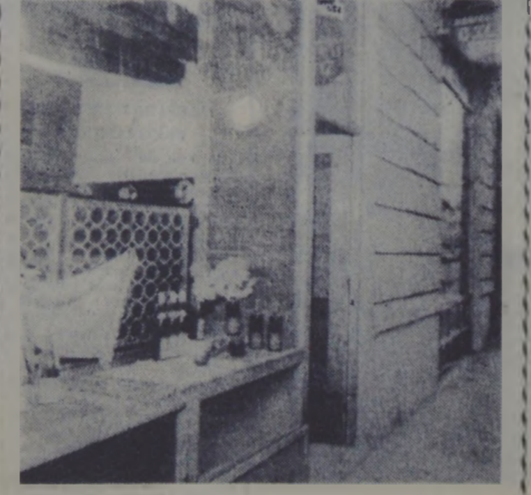
R.S. CECOSLOVACA — În foto: aspect din barul românesc „La Silca de aur” recent deschis la Praga.