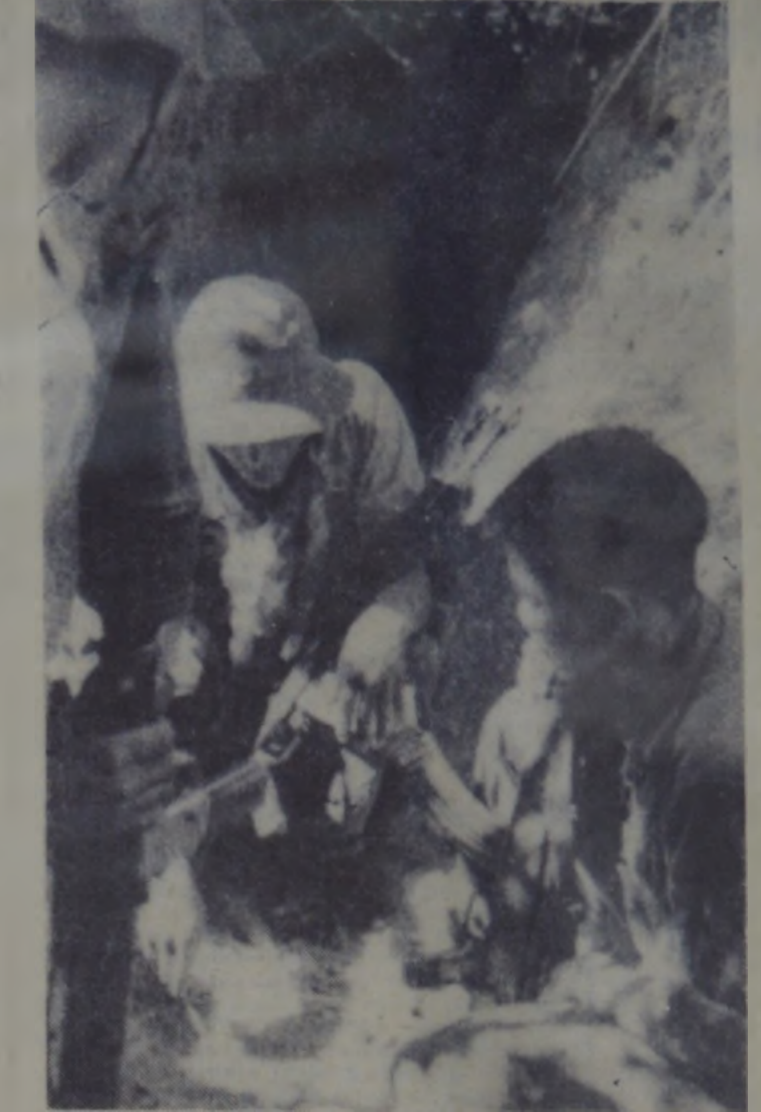
VIETNAMUL DE SUD — În foto: un soldat românesc pregătindu-se pentru un atac în regiunea Quang Tri.