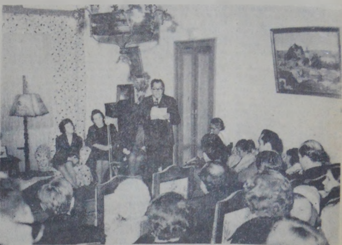
Aspect din timpul manifestării de la Vinărioari.