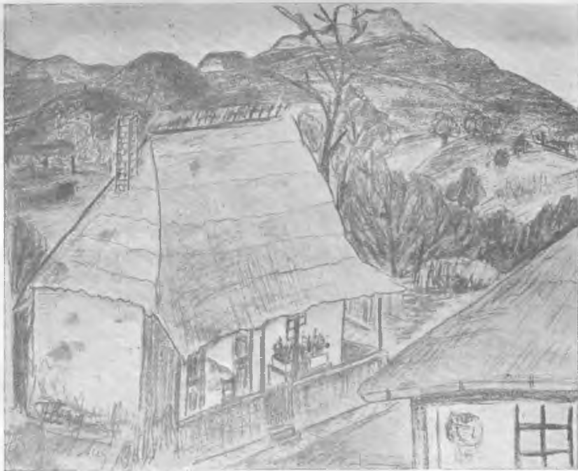
CĂSUȚĂ DIN HUREZ (VÂLCEA) — Desen de Florica Ionescu-Purșch (Doina Bucur)

Supliment artistic al revistei „Inmuguriri” Anul 6 No. 7-8