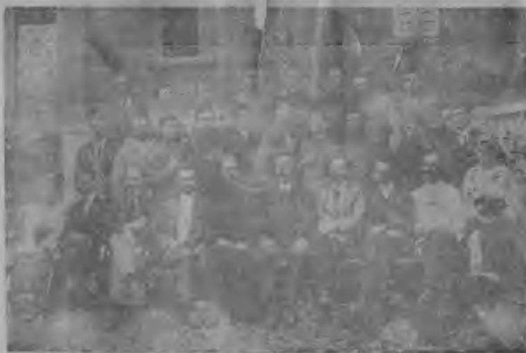
Prima serie de absolvenți ai școalei Normale „Gh. Asachi” din Piatra-Neamț. (Acum 25 ani),

Revista Asociației Învățătorilor din Județul Neamț