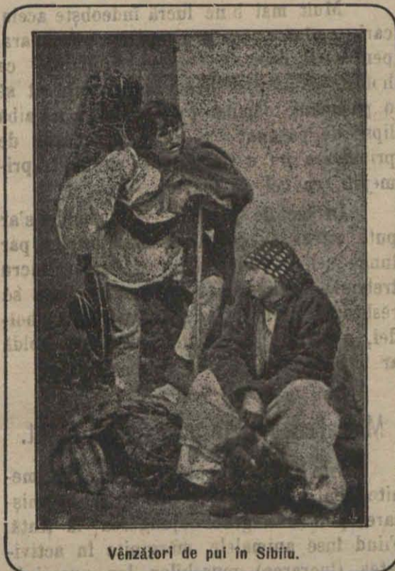
Vînzătorii de pui în Sibiu.

Păstrarea în pivniță este negreșit cea mai sigură și mai îndemnată, presupunînd însă că aceasta este uscată, în destul pe afundă și provăzută cu mijloace de aerisare. Avînd un castan gol pentru straturile calde, iernarea legumelor se poate face în mod foarte ușor. Castanul se prevede cu un înveliș de frunze, asigurându-se în contra păturii gerului prin ferestre și coperiș. Fără acoperire în liber se țin: salata de isrnă, salata de câmp, spinacul de iarnă, păturanței ș. a.