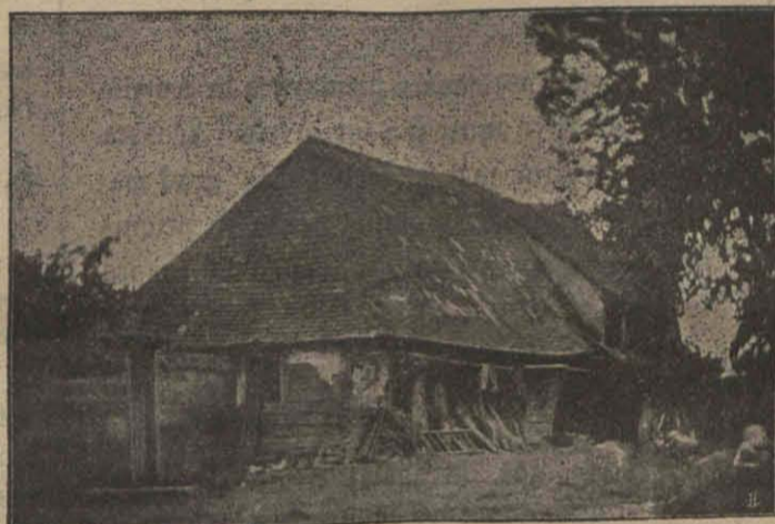
Casa natală a lui Andreiu Murășan.

Ilustrația, ce o dăm azi, privește leagănul, pruncia lui Andreiu Murășan . Este chipul casei în care s'a născut marele poet, la 16 Noemvrie 1816. În această casă săracă și modestă a stat leagănul aceluia, care mai târziu prin puterea talentului său a îmbogățit literatura română cu „Deșteaptă-te Române din somnul cel de moarte” și alte mărgăritare ale poeziei române.