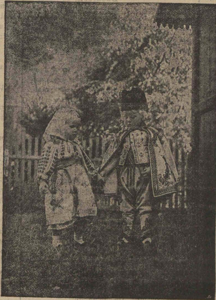
Micii Prinți ai României.

Dăm azi cetitorilor nostri portretul a două odrasle scumpe ale dinastiei române, copii Principelui și Principesei de coroană Ferdinand și Maria. Ei vor fi chemați odată să joace