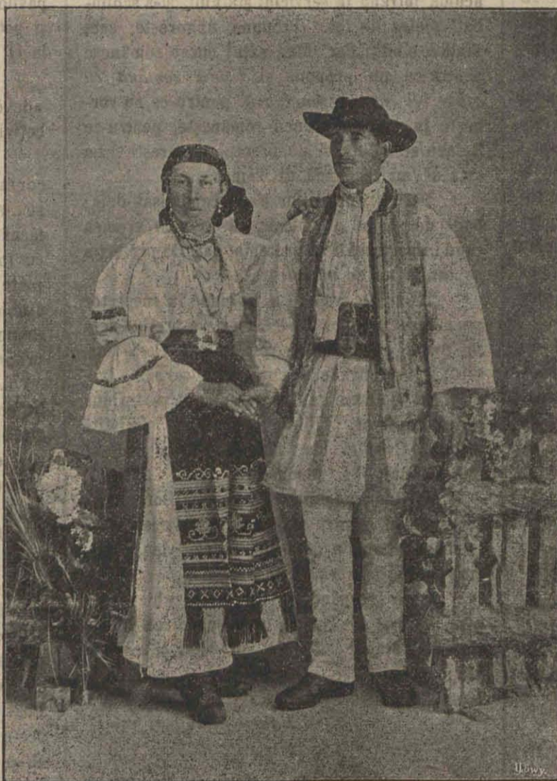
Țărani români din Șoimuș.

Înainte de fătare să 'i-se deie atențiune (băgare de seamă) ugerului. Până-când ugerul e moale și la tras nu curge de loc lapte din țite, nu este de lipsă o tractare deosebită a aceluia; îndată-ce ugerul devine mai tare și laptele se slo-