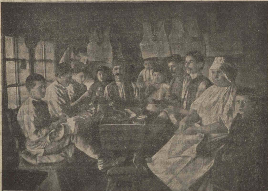
O lucrătoare de cojocărie în Seliște.

Femeile din Seliște și jur sînt vestite și mult admirate pentru frumusețea lor, care