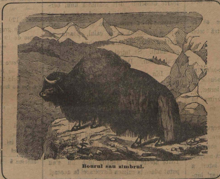
Bourul sau zimbrul.

Cu vremea însă în Carpați s'a tot împuținat și s'a stîrpit de tot, cum și în alte părți ale Europei. În Ardeal cel din urmă bour a fost pușcat la 1762 în pădurile Bărgăului. De atunci pe la noi nu s'a mai văzut. Astăzi se află numai în Canada și în Lituania (Rusia, în pădurea împărătească dela Bjalovjeș). Aici e oprit a-l vîna, vînd astfel guvernul rusesc ca să nu se stîrpească cu totul, ci de nou să se sporească.