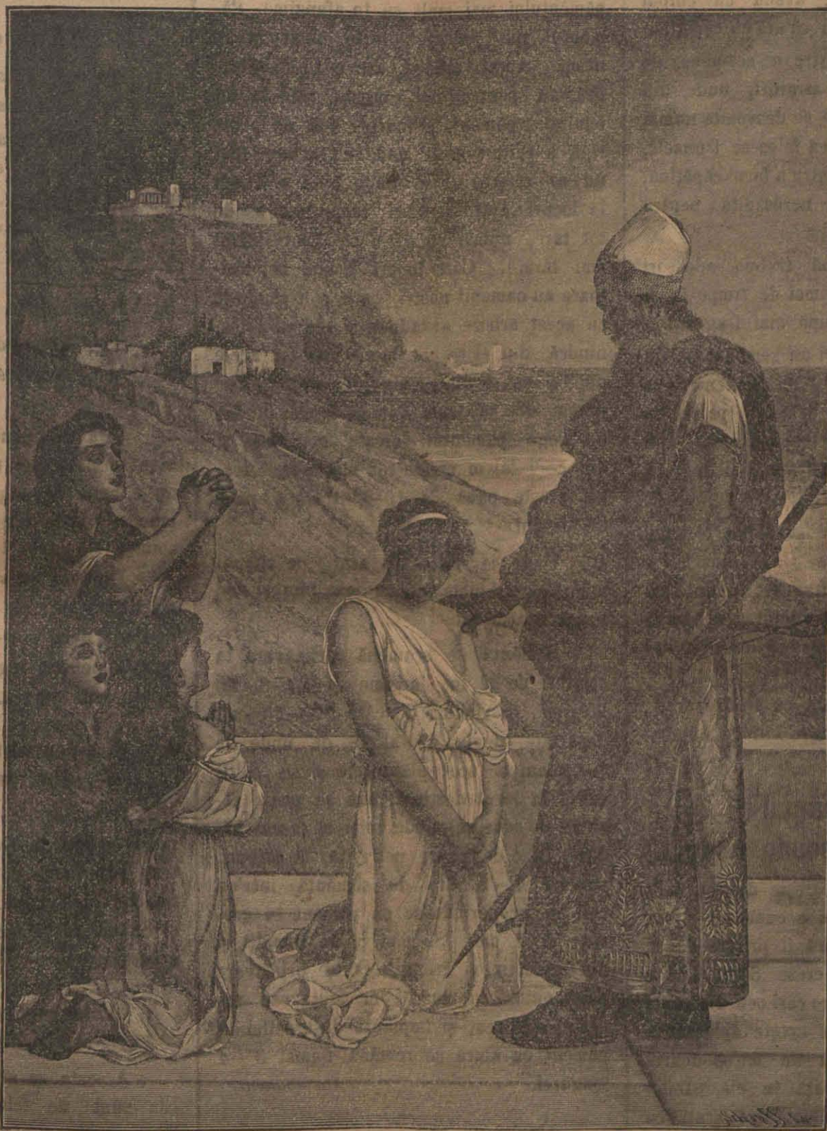
Răsbunare și milă.

Să înțelege, că mai ușor ne putem apăra împotriva peronosporii, dacă se stropesc regulat toate viile. De aceea e bine să se întemeieze însoțiri de viieri, prin cari mai cu ușurință se poate face apărarea împotriva ei.