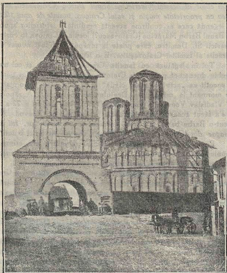
Biserica Sf. Dumitru înainte de dărâmare (1889).

sau preinși ctitori ai Catedralei Mitropolitane din Craiova sunt pomeniți și frații Petru și Asan, conducătorii imperiului Româno-Bulgar pe la 1185. Un alt presupus ctitor este craiul Ioan al Cumanilor, care a trăit pe la 1230. După părerea lui Hașdeu, craiul Ioan e întemeietorul Craiovei și poate și al bisericii Sf.