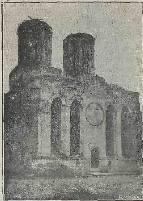
Biserica Sf. Dumitru în anul 1889, văzută din față.

In numele Tatălui și al Fiului și al Sfântului Duh, Amin. Această sfântă și dumnezeiască biserică, în care se cinstește și se prăznuiește hramul Sfântului Mare Mucenic Dumitru, izvoritorul de mir, ocrotitor al Craiovei, s'a ridicat din nou pe străvechi temelii în anul 1652 (sic), de către slăvitul întru pomenire Voievod Matei Basarab Domnul Țării Românești și Elena Doamna soția sa, în inima acestui oraș așezat pe moșia strămoșească a neamului Basarabesc și fiind cea mai veche și de frunte biserică