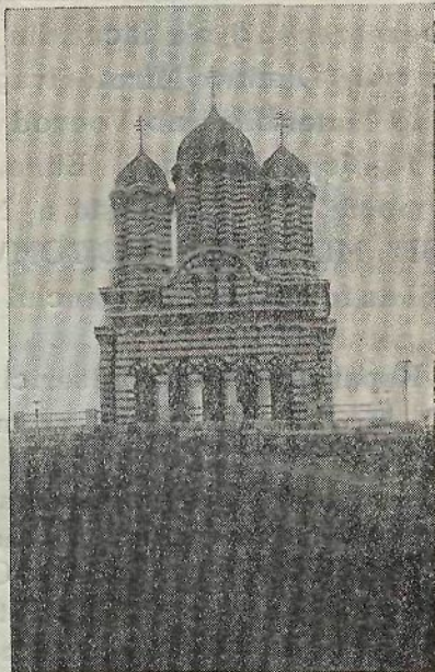
Biserica Sf. Dumitru din vremea noastră

plarea răzmiriții ce au fostu mai nainte, iară s'a fost stricat ca și mai înainte. Și-au rămas ținara această din Oltu incoace suptu stăpânirea Neamșilor și răposându dumnealui Pătru Obedeanel biv vel armași, l-au îngropat într'această biserică. Iară feciorulu dumnealui Constandin Obedeanel vel stolnic au pus cheltuiala dumnealui de o au dus și o au acoperit cu șindrila și au pus pietri și fieră pe la ferestri, împreună și sticle sus și jos, și înfrumusețându-o cu zugrăveala, cumpărând și alte odoare pentru pomenirea părinților și a dumnealui și a totu neamul dumnealui, în zilele prea înălțatului împărat Carolu alu șasălea, biruitor, la anul dela