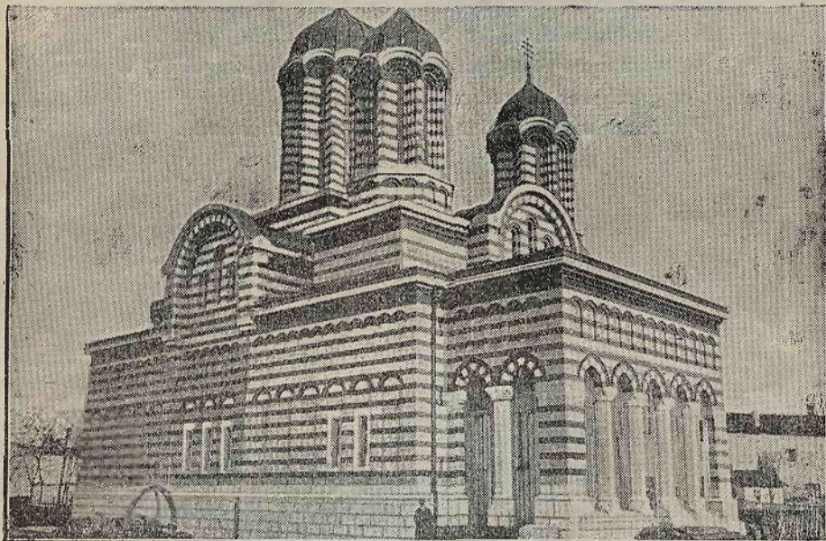
Biserica Sf. Dumitru, Catedrala Mitropolitană.

După redeschidere biserica Sf. Dumitru a avut următorii slujitori: Pr. Gh. I. Barbu, paroh, numit pe data de 15 Octom-