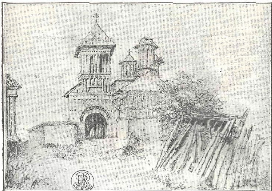
Biserica Sf. Dumitru în anul 1847. Desen de Barbu Iscovescu.

Acum vin vremuri foarte grele pentru Biserica Domnească din Craiova. Nu știm din a cul vină averea ei începe a se trosi. În zadar încearcă Domnitorul Grigorie Dimitrie Ghica, prin hrisovul dela 8 Martie 1826, să-i mai dea vieață întărind scutirile și privilegiile vechi ale bisericii. Din lipsa de supraveghere a celor orânduiți să-i poarte de grijă și din vina arendașilor, hotarele moșiei Pungina din Mehedinți sunt călcate de toți vecinii.