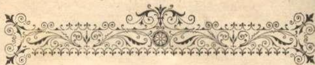
TABLA DE MATERIÎ.