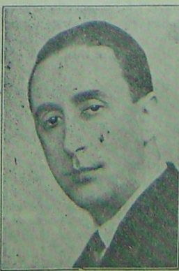
d. Bejan fost Ministru